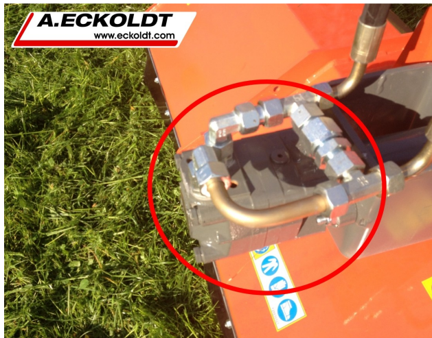
Drehmomentstarker OMS-Hydromotor mit Freilauf

A. Eckoldt / Industrie- und Landtechnik GmbH Tharandter Straße 37 / 01723 Grumbach