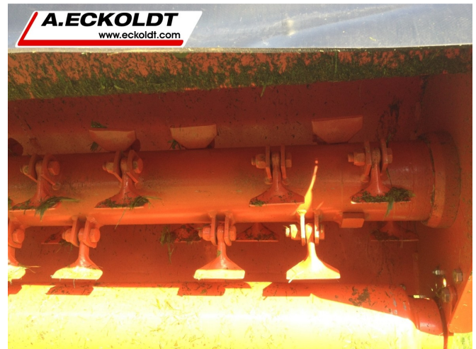
Hammerschlegel aus Spezialstahl