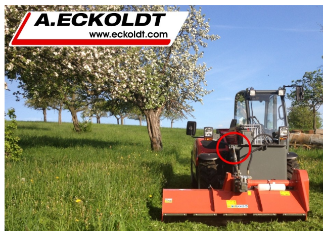
Mulcher im Betrieb nach rechts versetzt