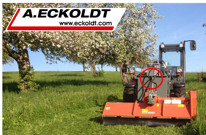
Mulcher im Betrieb mittig vor der Maschine